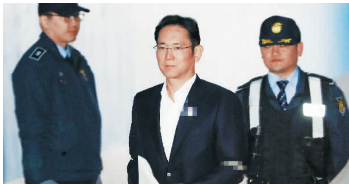
27日,韩国首尔,李在镥抵达法庭。