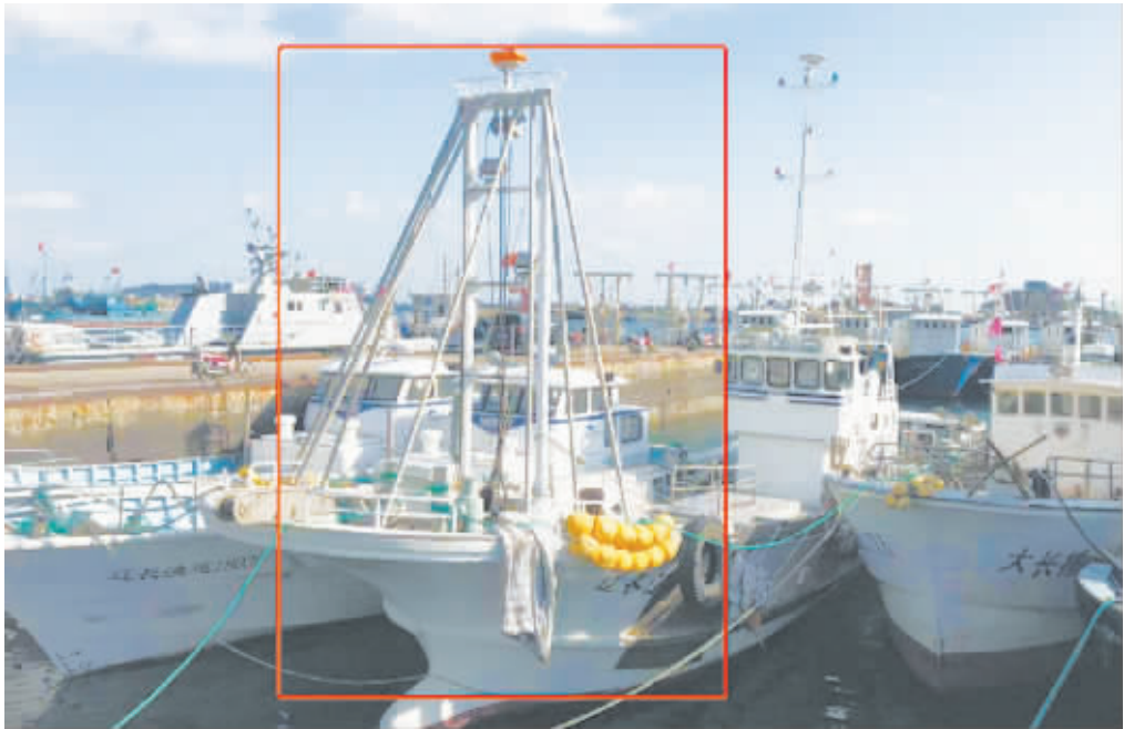
红框标识的为扇贝捕捞船只