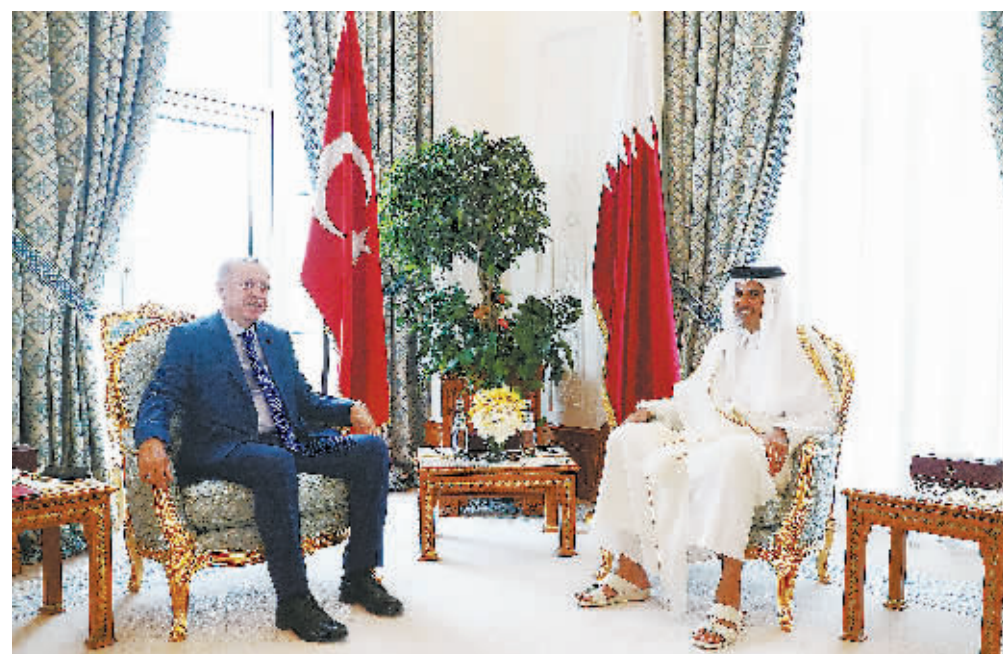
25日，卡塔尔埃米尔(国家元首)塔米姆(右)会见土耳其总统埃尔多安。

卡塔尔埃米尔(国家元首)塔米姆25日与来访的土耳其总统埃尔多安举行会谈，磋商地区局势。