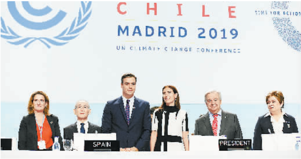
2日,西班牙马德里,联合国气候大会(COP25)开幕。

新一届联合国气候变化大会2日在西班牙马德里开幕,各国与会代表将就《巴黎协定》实施细则等议题展开进一步谈判。这次大会包括《联合国气候变化框架公约》(下称《公约》)第25次缔约方会议等多个相关活动。按计划,大会将从2日持续至13日。有关机构提供的数据显示,约2.9万人参加大会。