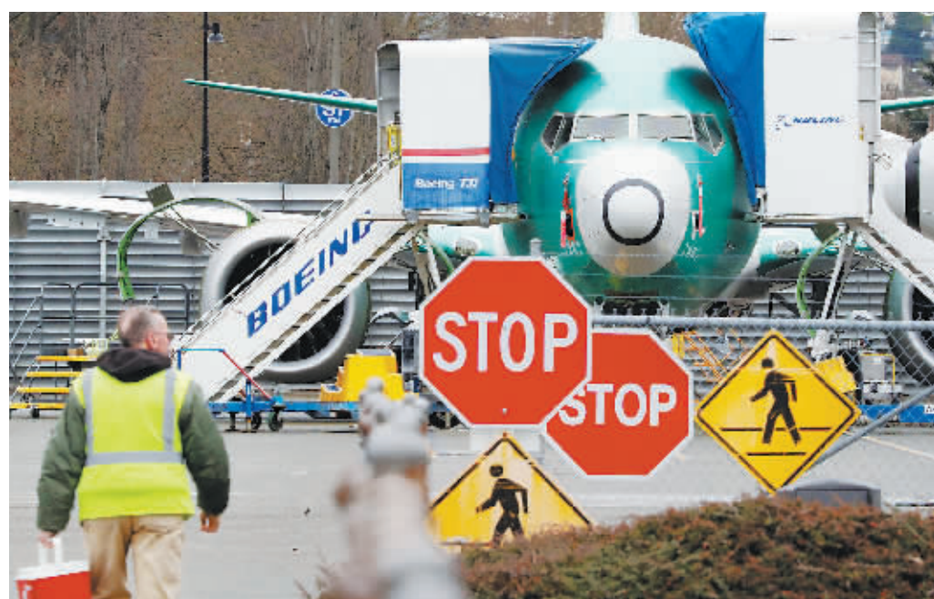
16日,在美国华盛顿州伦顿波音工厂,一名员工从一架波音737 MAX飞机旁经过。

美国波音公司16日发表声明说,因美国联邦航空局今年内无法完成737 MAX系列飞机复飞认证,公司决定从明年1月起暂停生产该系列飞机,优先完成737 MAX系列已完工飞机的交付。