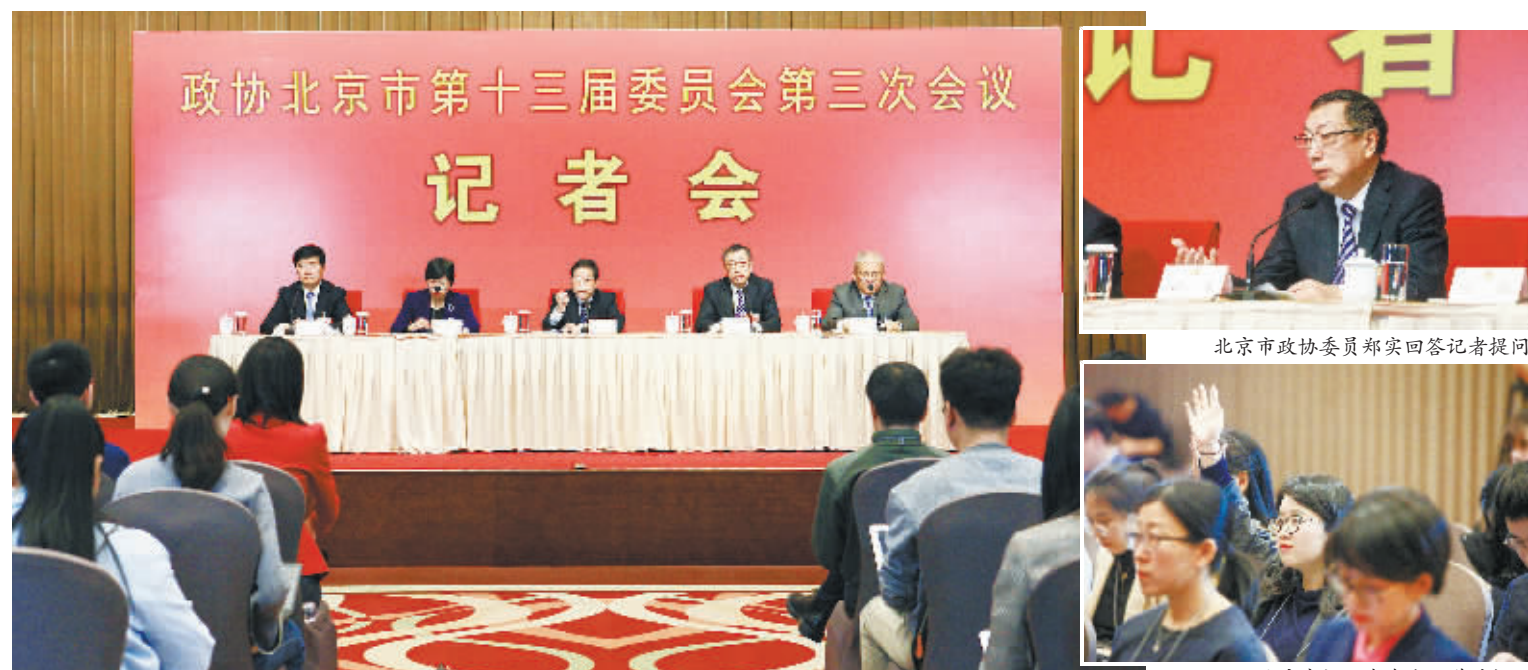
政协北京市第十三届委员会第三次会议记者会举行