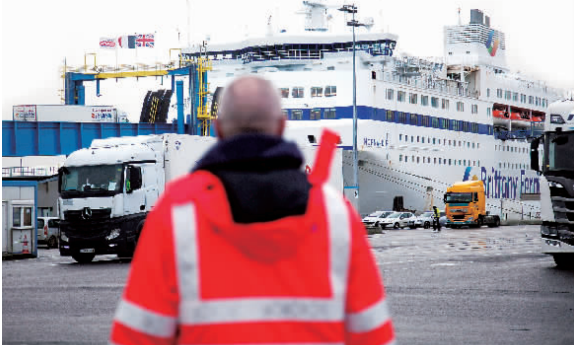
1月30日,法国北部卡昂-乌伊斯特勒昂港,工作人员注视着一艘将开往英国的渡轮。

一别两宽,只是小说里的情节,对于“分手”后的英国和欧盟而言,11个月的过渡期正是互相角力的好时机。一贯我行我素的英国首相鲍里斯·约翰逊自是不肯让步,而足够了英国这几年拖拖拉拉的欧盟也试图趁机挽回颜面。从贸易规则到渔业竞争,双方的拉锯战正式步入白热期。一边是欧盟寸步不让,另一边,英国也不会让自己孤立无援,美国、日本、澳大利亚等都是名单上等待握手的伙伴。