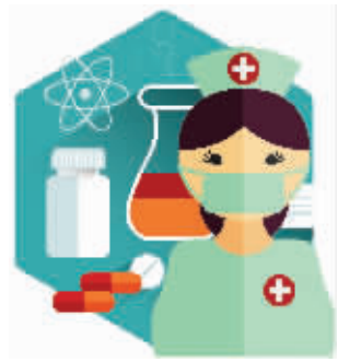
韩国新冠肺炎最新疫情

继日本之后,韩国也在新冠病毒面前“沦陷”了。确诊病例在几天之内急剧攀升,伴随着“超级传播事件”的出现,一系列连锁反应也开始浮出水面,三星电子、SK海力士接连中招,关厂的关厂,隔离的隔离。如今韩国的疫情预警已上调至最高级别,就像韩国总统文在寅所言,新冠疫情面临重要分水岭,接下来几天是重要关头。