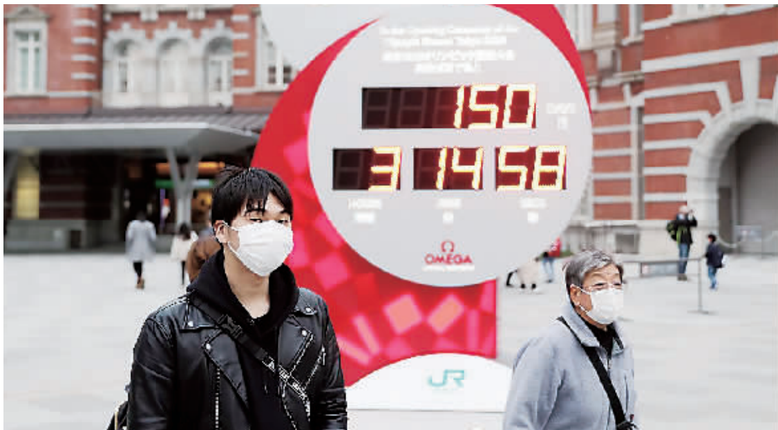
25日,在日本东京,行人戴口罩经过显示东京奥运会倒计时时的电子屏。

的正式意见。同日上午,日本官房长官菅义伟也在新闻发布会上表示,国际奥委会已告知日本,东京奥运会的准备还在继续。