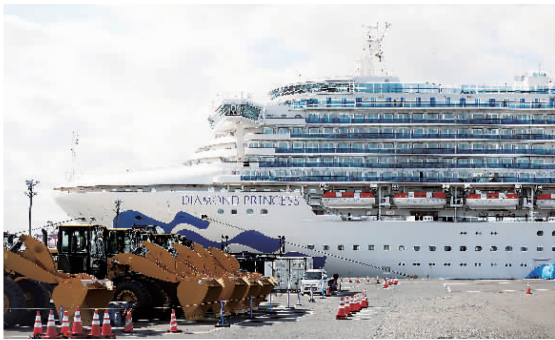
死亡病例曾乘坐“至尊公主”号的事实，让事态变得更加严峻。图为此前停靠日本横滨的“钻石公主”号邮轮。

作为“至尊公主”号的运营公司，公主邮轮公司称，CDC已经与他们取得了联系，确认有62名曾参加了墨西哥航程的旅客仍然在“至尊公主”号上，CDC要求和该患者有过接触的62名乘客待在自己的包间内，等待检测。