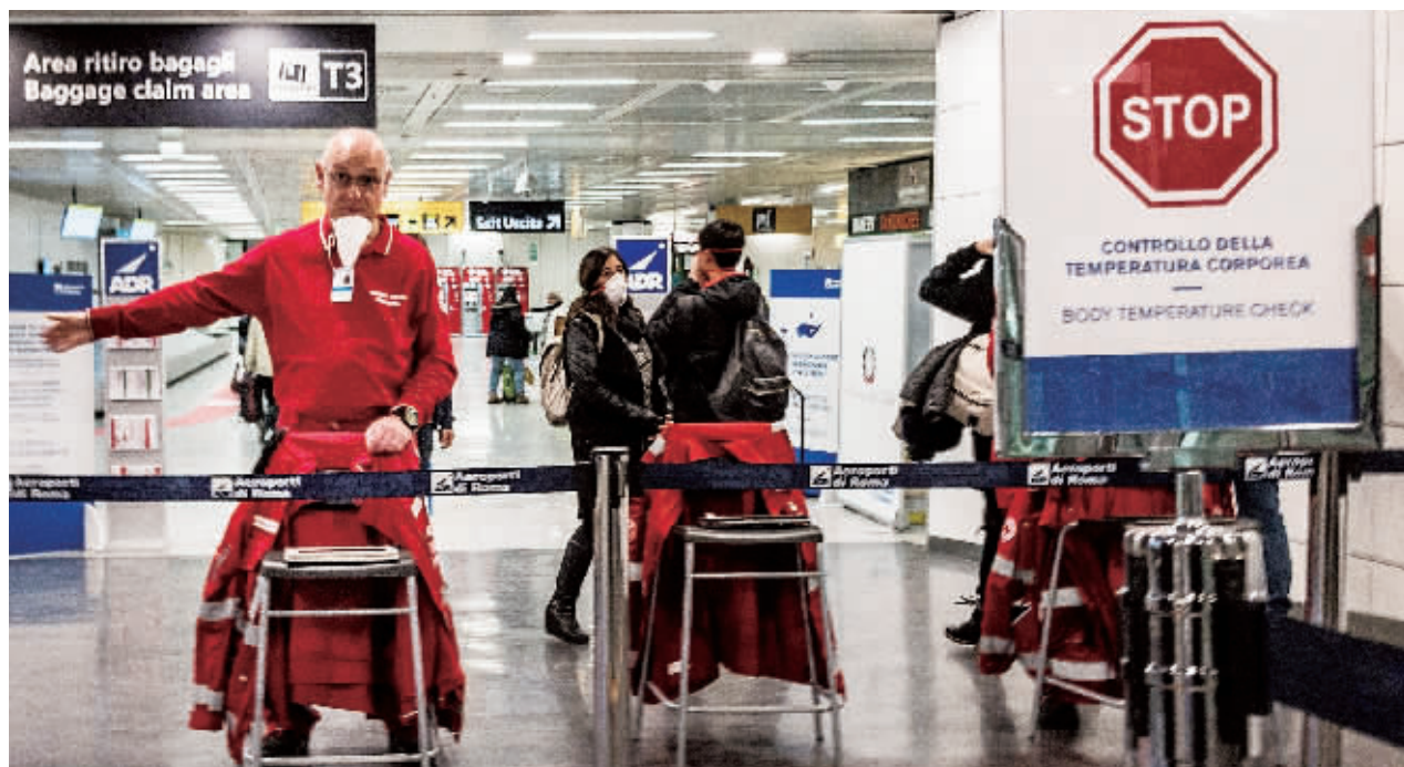
3月7日，意大利罗马菲乌米奇诺机场，工作人员引导从巴黎到达的旅客接受体温检测。

急速扩散的疫情席卷了意大利。单日新增确诊病例1332例、民主党主席被确诊感染……意大利关于新冠肺炎疫情的坏消息接二连三传来。这个擅长防守反击战术的足球国度，对于如今横行肆虐的病毒，仍然“防不胜防”。封锁大概是意大利能作出的最严厉的防守措施了，14个省被封锁，1600万人行动受限，进入全国紧急状态的意大利终于下定了决心。