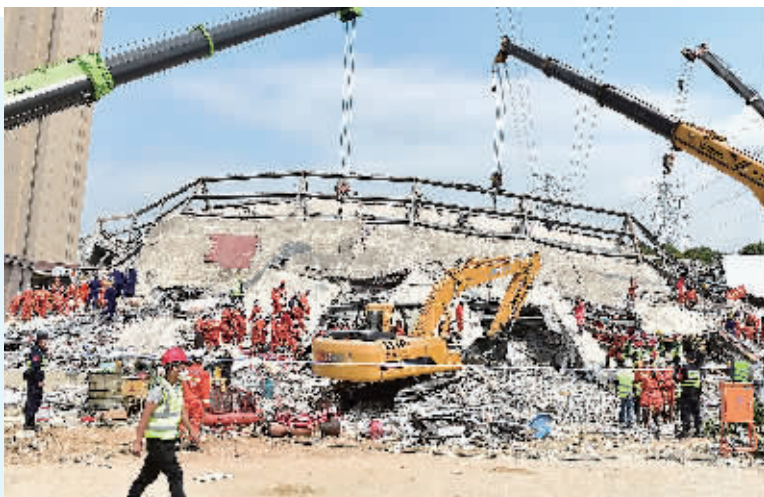
泉州市鲤城区欣佳酒店坍塌事故救援现场