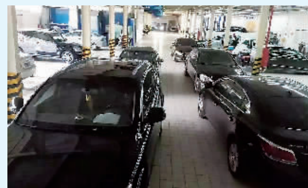
全德宝车行展厅,位于泉州欣佳酒店所在建筑一层,图中立柱为钢结构