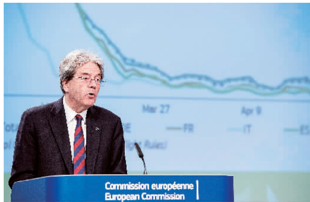
6日,在欧盟委员会总部,负责经济事务的欧委会委员保罗·真蒂洛尼出席新闻发布会。

欧盟委员会6日预测,受新冠疫情影响,2020年欧洲经济将出现“历史性衰退”,欧盟经济将萎缩7.5%,欧元区经济将萎缩7.75%。