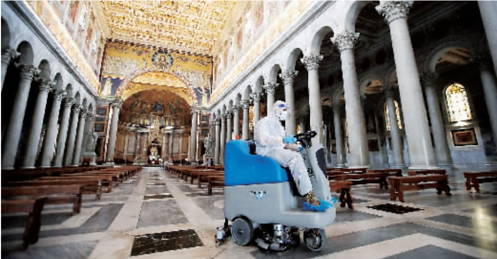
5月16日,工作人员在意大利首都罗马郊区的圣保罗教堂进行消毒作业。

意大利总理孔特16日晚宣布,从6月3日起民众将可以跨地区自由出行,同时意大利将开放与申根区国家间的人员流动;这将为旅游业的复苏奠定基础”。