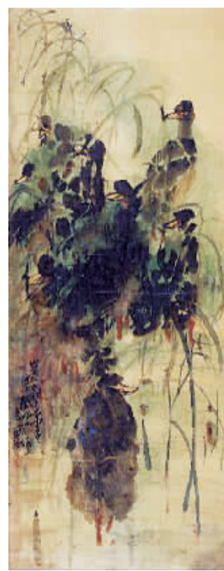
林风眠1929年致宝初叔祖巨幅绢本彩墨《集义图》(205×81cm)

这批画作题材多样、品相完好，包含了艺术家从十几岁的锋芒初现，到欧洲学成归来初担重任，再到意气风发推行现代观念等一系列不同阶段的作品，皆为首次现身拍场，极具收藏价值。