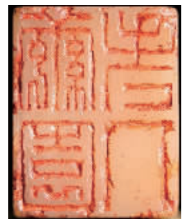
黄易刻古兽钮寿山芙蓉石张符升自用印

本次西泠春拍名家篆刻部分，呈拍黄易刻古兽钮寿山芙蓉石张符升自用印。黄易，清中期金石学大家；“西泠八家”之一。此印作于乾隆四十九年(1784)，边款信息丰富，时间、地点、人物俱全，是黄易盛年之作，被收录于《丁黄印存合册》并另有十余处出版著录。印文中“茧园老人”为河间同道张符升，黄易对受印人以父执辈事之，因此是蒙恩之作。近年黄易尺牍的整理和综合考证，把黄易研究推向深入，带出与他关系紧密人物的生平行年、交游行迹。黄易尺牍以故宫博物院为收藏大宗，其中就包括黄易致张符升之子张爻鼎五札。此批信札后附有此方“茧园老人”之印蜕。