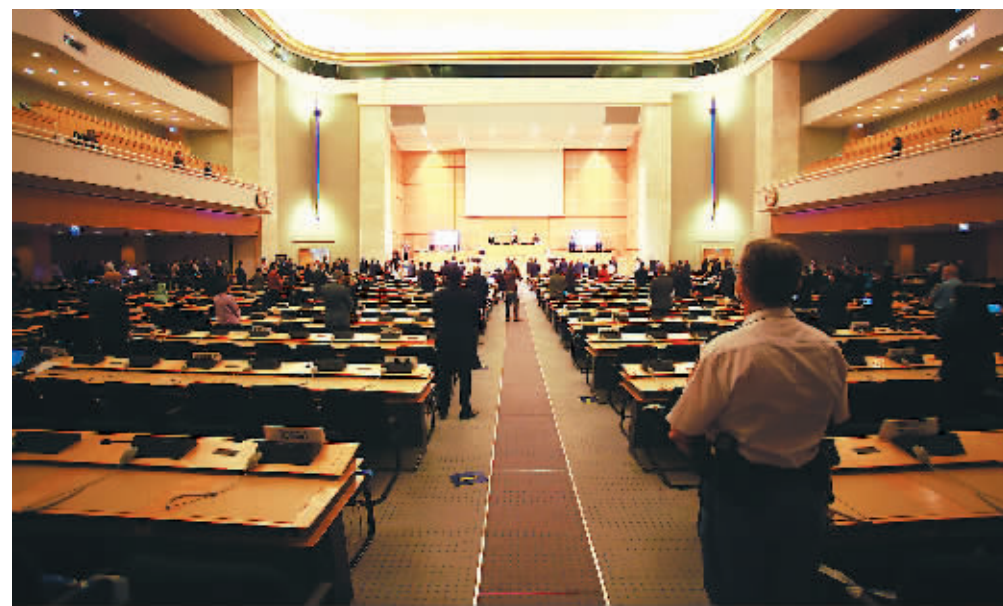
17日,联合国人权理事会在瑞士日内瓦就弗洛伊德之死所暴露问题举行紧急会议。

应联合国非洲集团要求,联合国人权理事会17日举行紧急会议,就美国非洲裔男子乔治·弗洛伊德遭遇警方暴力后死亡所暴露的种族歧视、警察暴力等问题进行讨论。