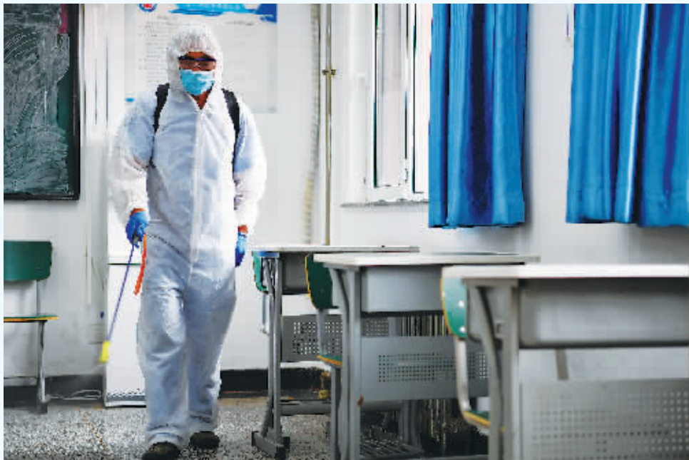
高考前夕,防疫人员对考场进行消毒。

此前,由于高校提出的选考科目要求并不十分严格,浙江、上海等地的高考改革经常出现功利博弈弃考等情况。如大规模的“物理弃考”,引发社会广泛关注。而北京在推进新高考之后,由于高校提出的要求相对来说更为严谨和严格,如大部分提供专业都提出必须要一门物理科目要求,还有少数专业提出两门必考等。之前发生的功利博弈、弃考物理