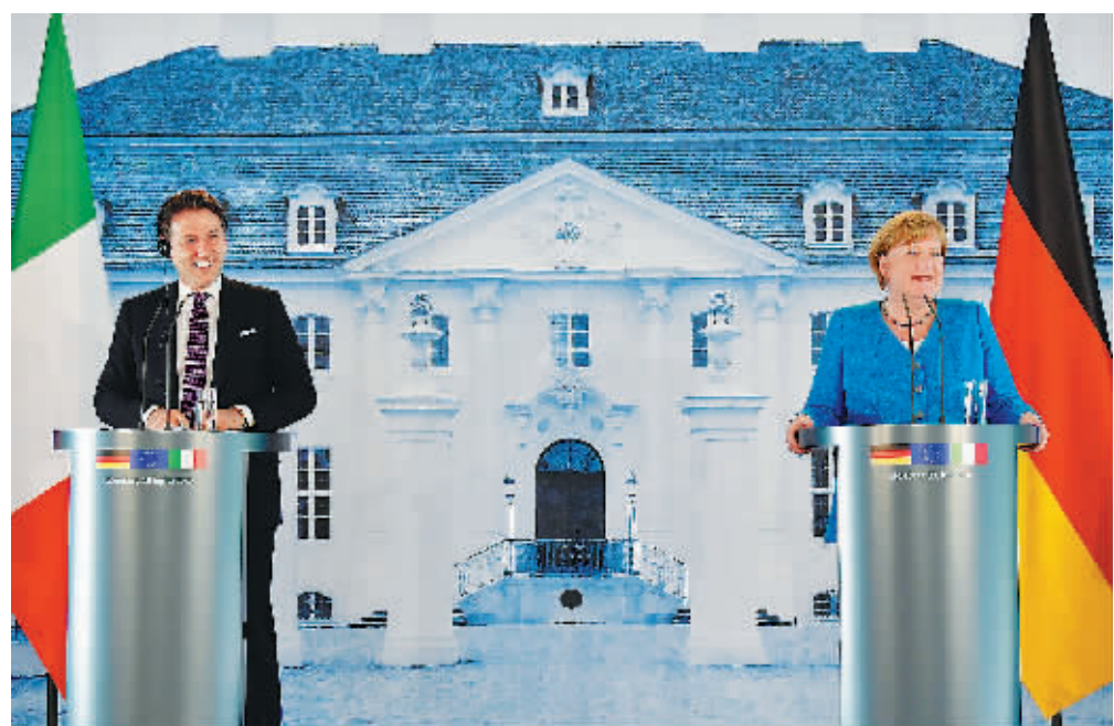
13日，德国总理默克尔（右）与到访的意大利总理孔特在德国举行会谈后出席联合记者会。

德国总理默克尔与到访的意大利总理孔特13日表示，欧盟应迅速采取有力行动应对新冠疫情导致的危机，尽快就“恢复基金”达成一致。