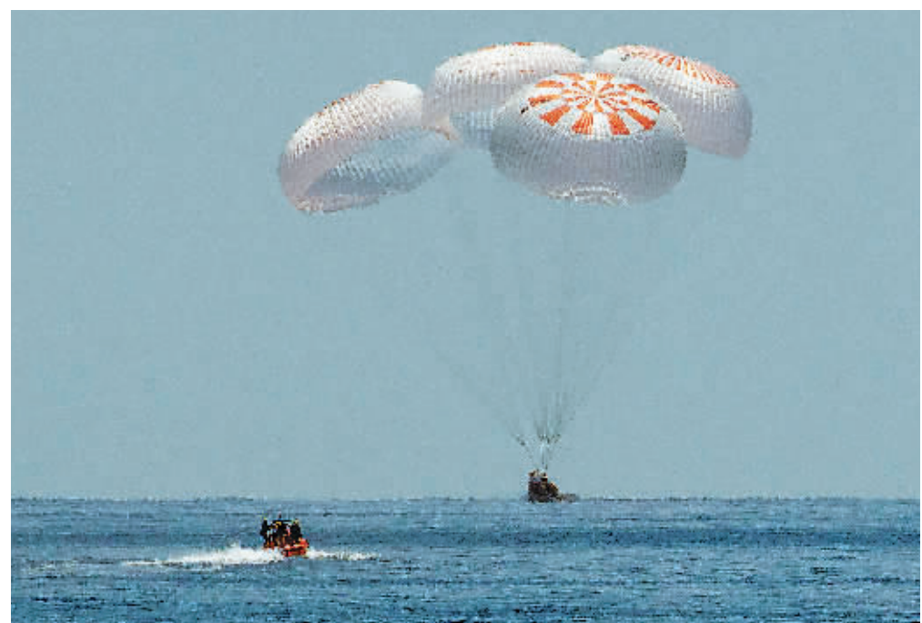
8月2日，太空探索技术公司“龙”飞船溅落在美国东南部佛罗里达州附近的墨西哥湾。

搭载两名美国宇航员的美国太空探索技术公司“龙”飞船2日返回地球，完成首次载人试飞任务。