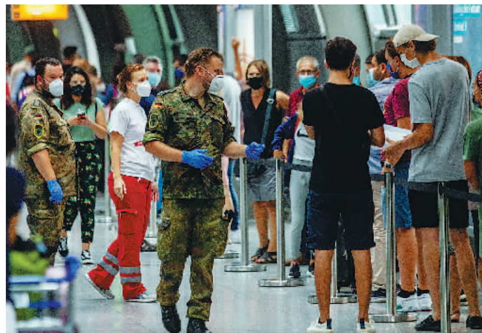
8月15日,德国士兵在法兰克福机场的新冠病毒检测站工作。

德国疾控机构罗伯特·科赫研究所15日更新新冠疫情报告说,德国疫情自7月初以来持续反弹,发展形势“令人担忧”。