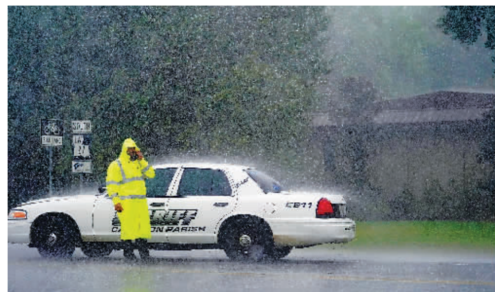
8月26日,一名治安官在美国路易斯安那州莱克查尔斯雨中执勤。

北京时间27日14点左右,美国国家飓风中心(NHC)表示,墨西哥湾飓风“劳拉”在路易斯安那州卡梅伦附近登陆,部分地区出现了灾难性的风暴潮、极端大风和暴雨。