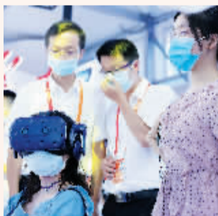
观众体验数字化成果