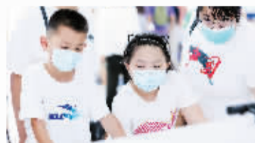
参展的小朋友正在体验VR游戏