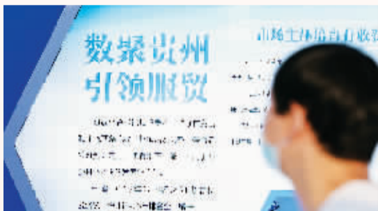
贵州展区主题: 数聚贵州 引领服贸

此外,贵州充分利用大数据探索服务贸易新模式、新业态、新经验,大力发展大数据、大旅游、大健康等优势产业,全方位推动全省服务贸易创新发展,为贵州省产业转型升级和扩大内陆开放作出了积极贡献。2016-2019年,贵州省服务进出口年均增长16.15%。