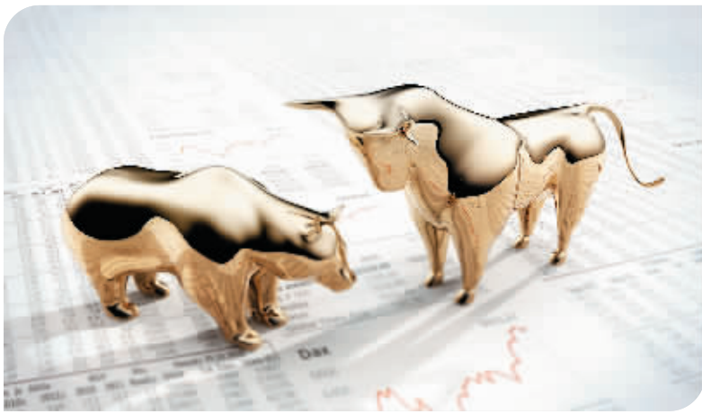
·天山生物二度停牌核查前五个交易日期间交易情况一览·

日二度停牌核查,目前尚未复牌。截至9月21日收盘,天山生物已停牌9个交易日,公司最新股价34.66元/股,总市值108.5亿元。针对相关问题,北京商报记者致电天山生物董秘办公室进行采访,不过未有人接听。