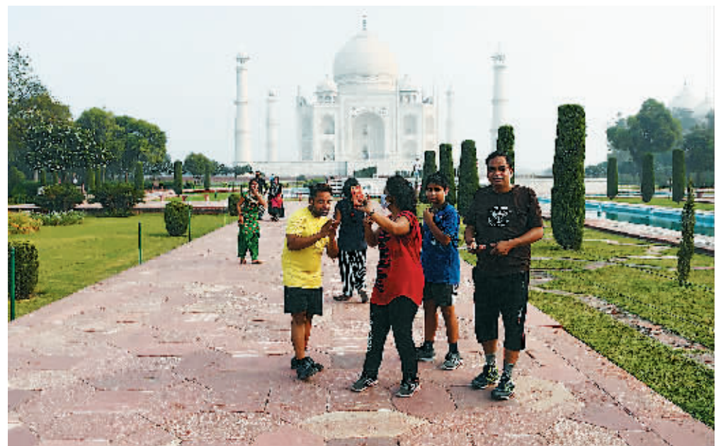
当地时间9月21日，印度泰姬陵重新对外开放，游客游览拍照。