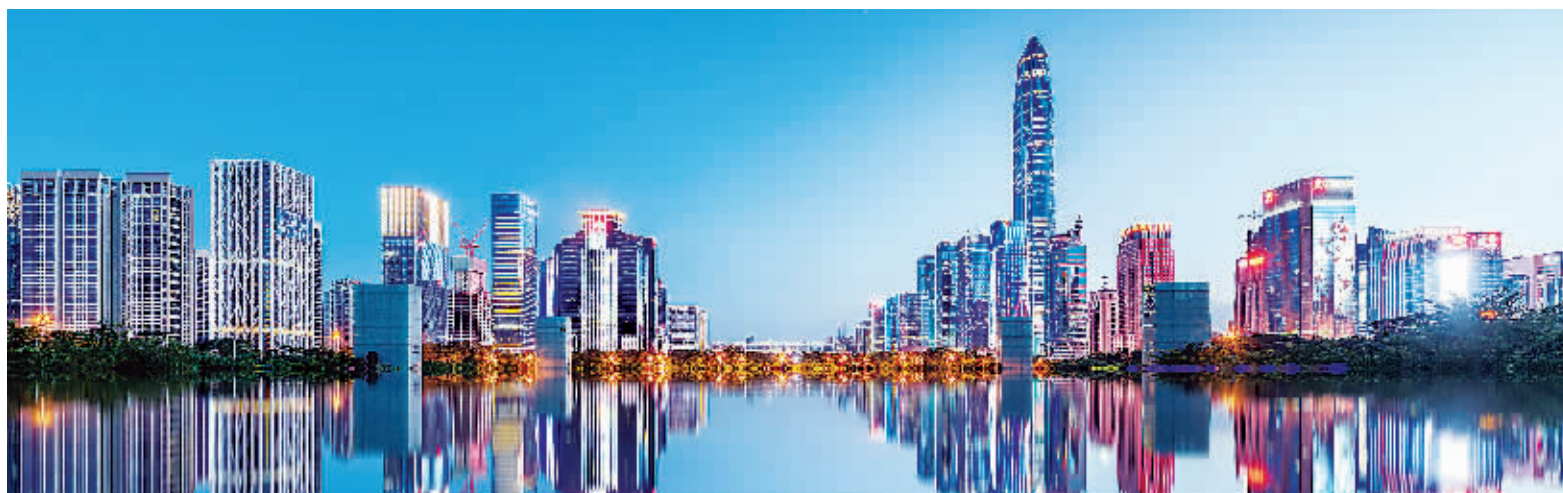
40年来,深圳实现了由一座落后的边陲小镇到具有全球影响力的国际化大都市的历史性跨越

据新华社电 深圳经济特区建立40周年庆祝大会10月14日上午在广东省深圳市隆重举行。中共中央总书记、国家主席、中央军委主席习近平在会上发表重要讲话强调,要高举中国特色社会主义伟大旗帜,统筹推进“五位一体”总体布局,协调推进“四个全面”战略布局,从我国进入新发展阶段大局出发,落实新发展理念,紧扣推动高质量发展、构建新发展格局,以一往无前的奋斗姿态、风雨无阻的精神状态,改革不停顿,开放不止步,在更高起点上推进改革开放,推动经济特区工作开创新局面,为全面建设社会主义现代化国家、实现第二个百年奋斗目标作出新的更大的贡献。