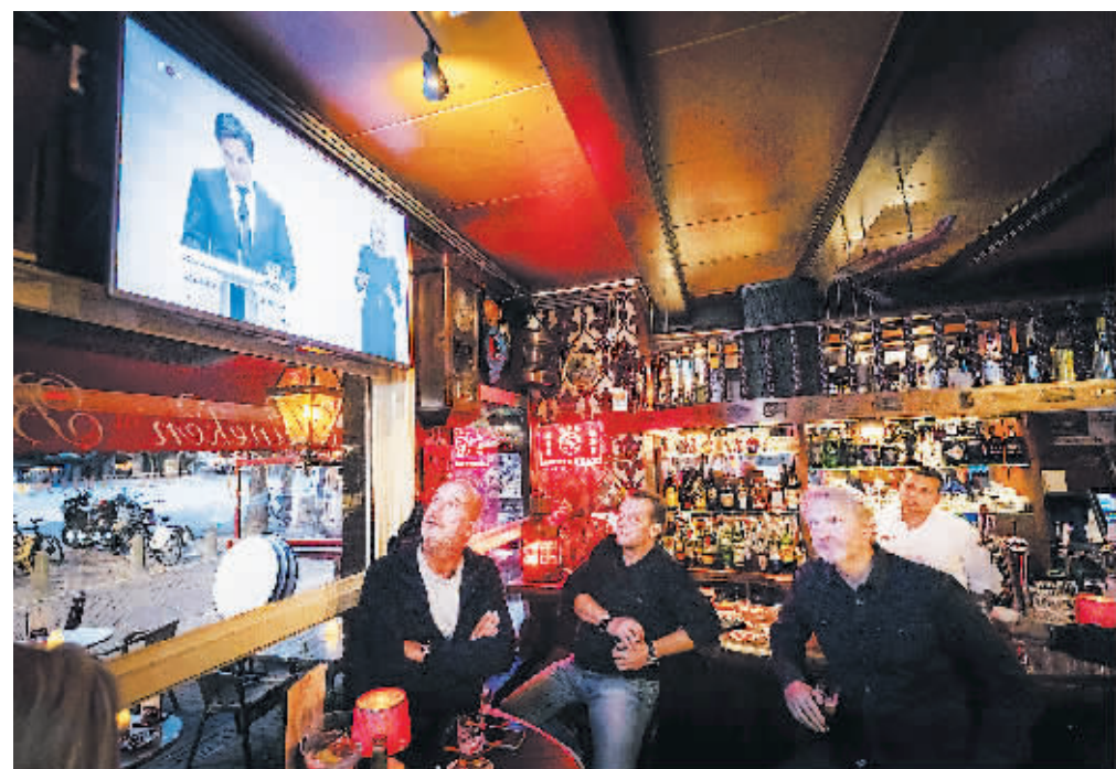
13日,在荷兰阿姆斯特丹,人们观看荷兰首相吕特出席新闻发布会的电视画面。