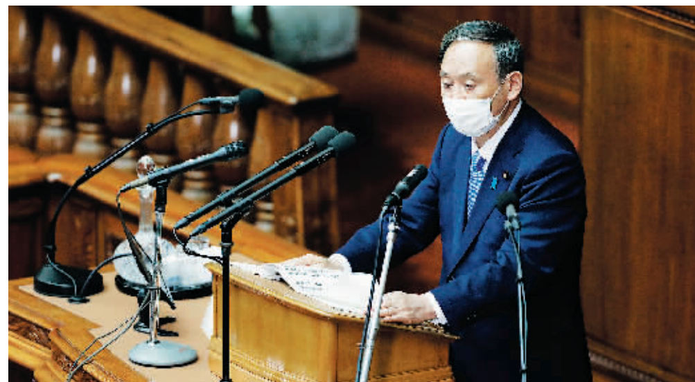
当地时间2020年10月26日,日本东京,日本首相菅义伟在国会发表就任后的首次施政演说。

当地时间26日,日本第203次临时国会召开,日本首相菅义伟在会议上发表了施政演说。强调在防止出现爆发性感染新冠病毒的基础上重启社会经济活动,促进经济早日复苏。