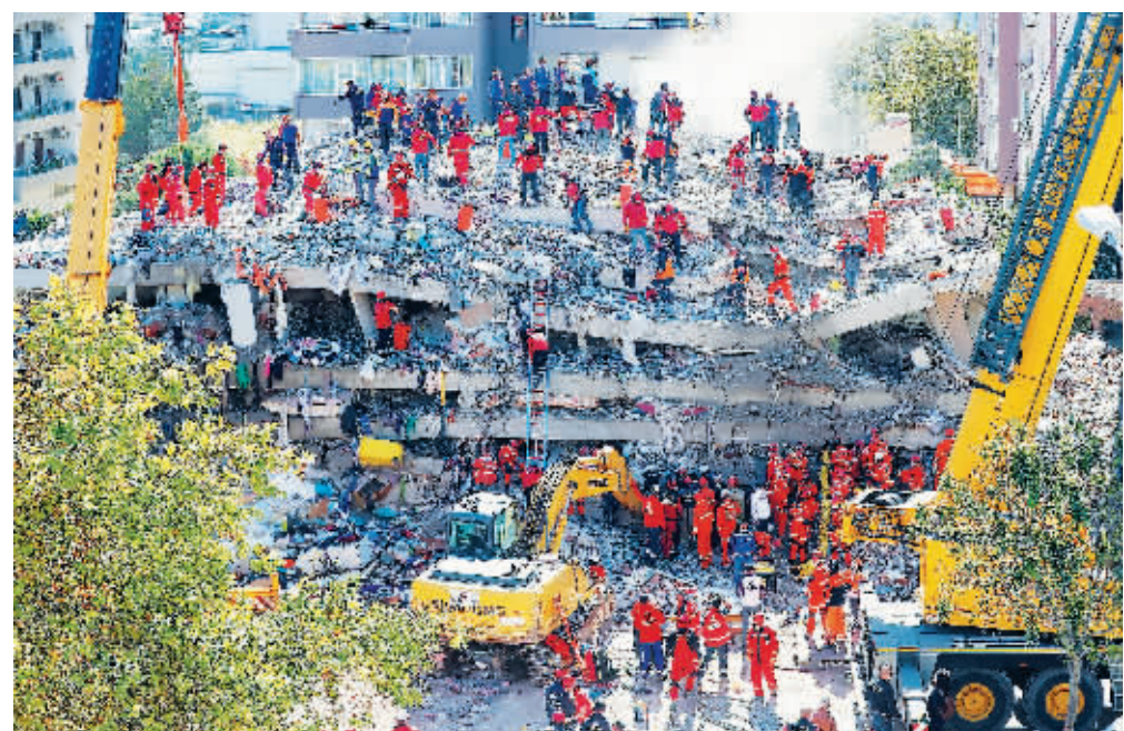
10月31日,救援人员在土耳其伊兹密尔省地震受灾现场工作。

当地时间10月30日14点51分,土耳其西部爱琴海海域发生6.6级地震。震中位于土耳其第三大城市伊兹密尔西部海域,震源深度16.5公里,属于破坏力较强的浅层地震。希腊首都雅典和土耳其的伊斯坦布尔等地都出现明显震感。