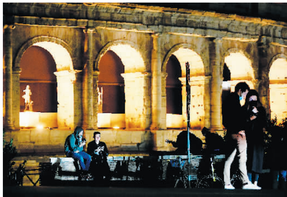
11日，人们在意大利罗马斗兽场附近休闲。

据欧联社报道，意大利紧急民防部10日发布疫情报告指出，截至10日18时，全国累计确诊病例逼近100万例，已达到995463例。其中死亡病例42330例，现存病例590110例，普通住院患者28633例，重症患者2971例，治愈患者363023例。在过去24小时，新增确诊病例35098例，死亡病例580例。