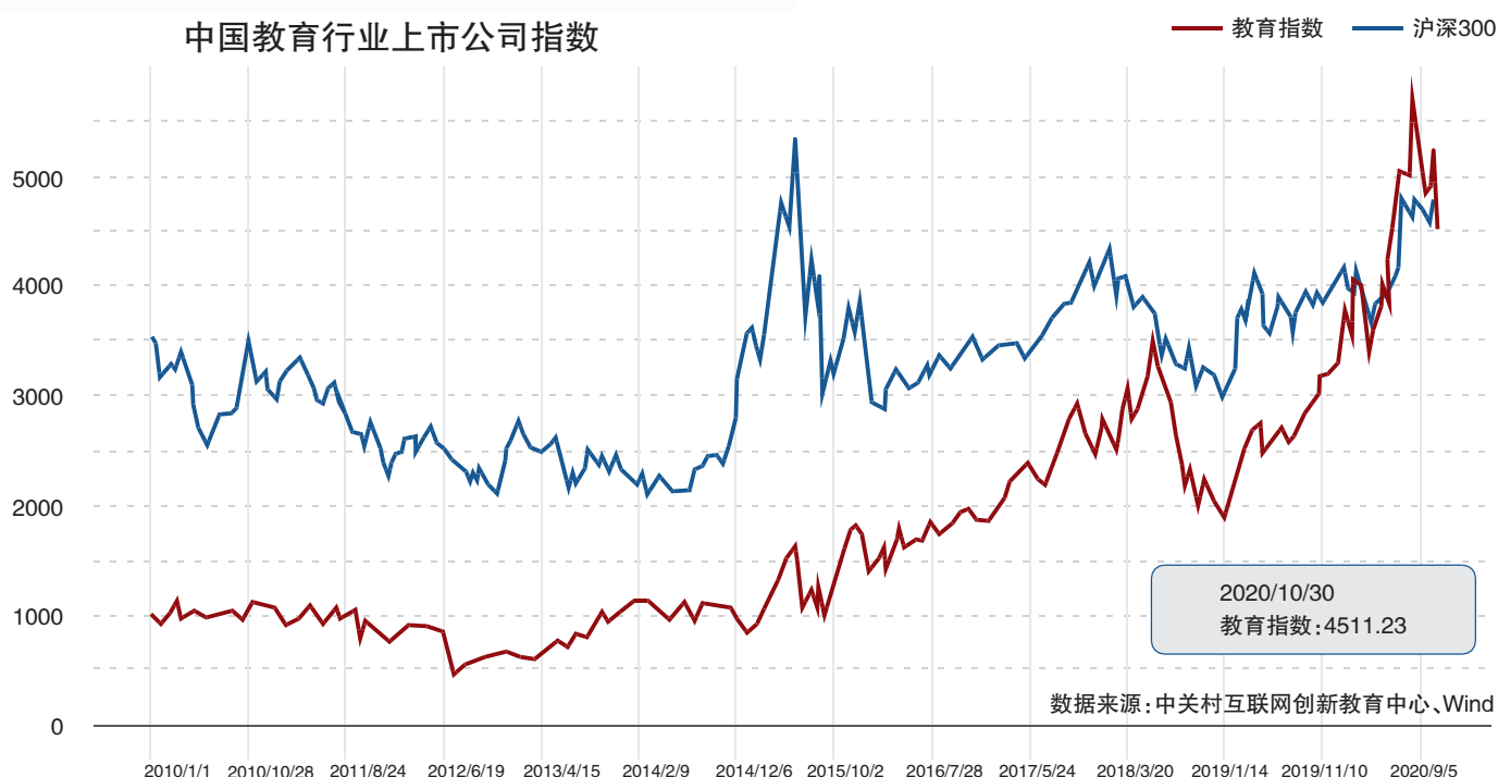
中国教育行业上市公司指数