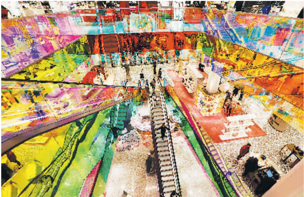
27日，人们在美国纽约萨克斯第五大街公司购物。

车企、任何一个品牌、任何一款车型都可能出现一些问题，关键在于出现问题之后如何进行有效处理和改善，从而给消费者和市场一个交代。总体来说，出现问题肯定是不利的，尤其对于在豪华电动车领域一枝独秀的特斯拉，还是应该谨慎对待、积极改进。 质量问题不是什么好兆头，毕竟当前的特斯拉还处于冲刺50万辆的关键期，今年前三季度，特斯拉交付了31.89万辆，并在Q3业绩会上确认将在今年年底前交付50万辆的目标，这意味着四季度的缺口是18.1万辆。 雪上加霜的是，特斯拉在欧洲市场似乎有节节败退的苗头。2019年第三季度，特斯拉在西欧新能源汽车的市场份额为33.8%，到了今年第三季度，特斯拉在该地区的份额降到了13.5%。今年10月，在欧洲电动车销量排行榜中，大众ID.3的销量达到了10315辆，跃居榜首；相较之下，虽然特斯拉Model 3在9月还是欧洲纯电动车销量冠军，但在10月，销量仅为834辆。 颜景辉表示，在中国和美国，特斯拉在纯电动车领域应该还是领先的，其他的车企品牌还没有完全跟上它，在中国是吃了客户结构的红利；相较之下，在欧洲市场，特斯拉遇到的竞争对手还是比较强的，比如说大众等德系车，其品牌力和客户群都是较强的竞争力。 对于欧洲市场，特斯拉也开始有所动作。今年早些时候，马斯克曾暗示，特斯拉可能会针对欧洲推出掀背车型。与此同时，特斯拉在德国柏林的工厂在迅速建设中。 北京商报记者 陶凤 汤艺甜