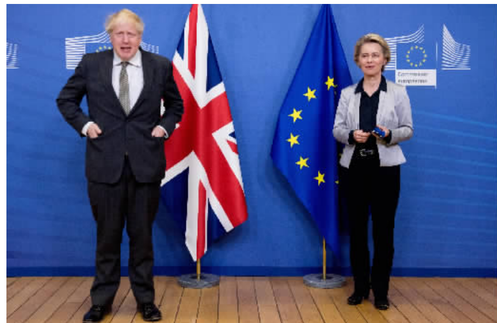
9日,英国首相约翰逊(左)与欧盟委员会主席冯德莱恩抵达欧盟总部,准备进行会晤。

当地时间10日,据英国天空新闻报道,英国外交大臣多米尼克·拉布表示,如果欧盟在谈判中没有“显著进展”,本周日(13日)将是英欧贸易谈判的“终结”。