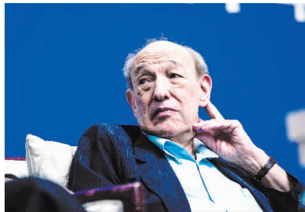
2013年4月24日，北京，华侨大厦，傅高义参加美国学会2005委员会海风论坛。

美国哈佛大学费正清中国研究中心20日表示，哈佛大学荣誉退休教授、著名中国问题学者傅高义逝世，享年90岁。