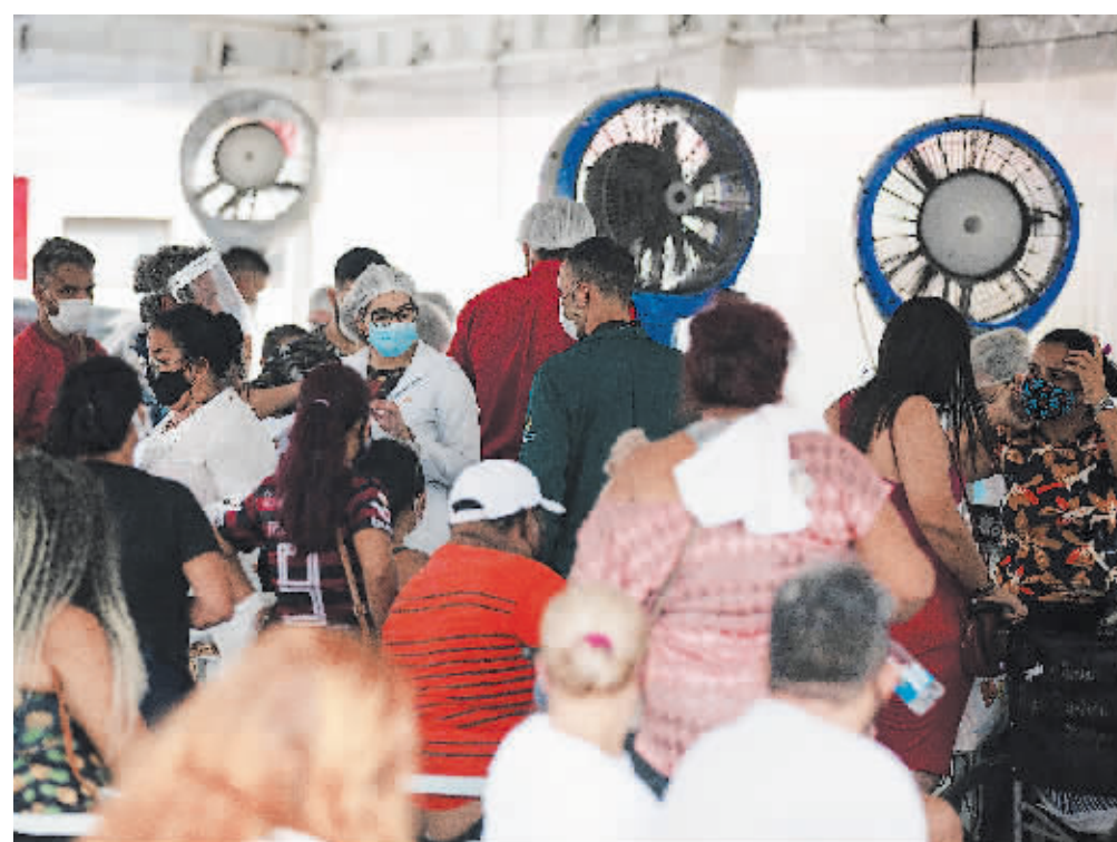
4日，巴西玛瑙斯，医务人员在公立医院门口推送新冠肺炎患者。

巴西圣保罗州卫生厅4日宣布，该州确认发现两例感染了英国报告的变异新冠病毒的病例。这是巴西首次确认在境内发现变异新冠病毒感染病例。