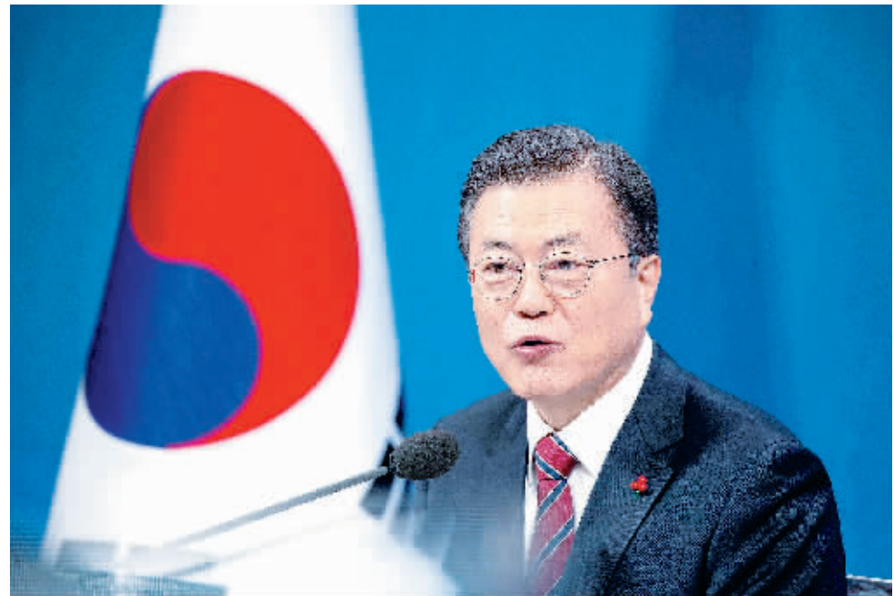
当地时间2021年1月18日,韩国首尔,韩国总统文在寅举行新年记者会。

当地时间18日上午,韩国总统文在寅在青瓦台春秋馆举行新年记者会谈,发表执政第5年的施政方向,解释过往政策。