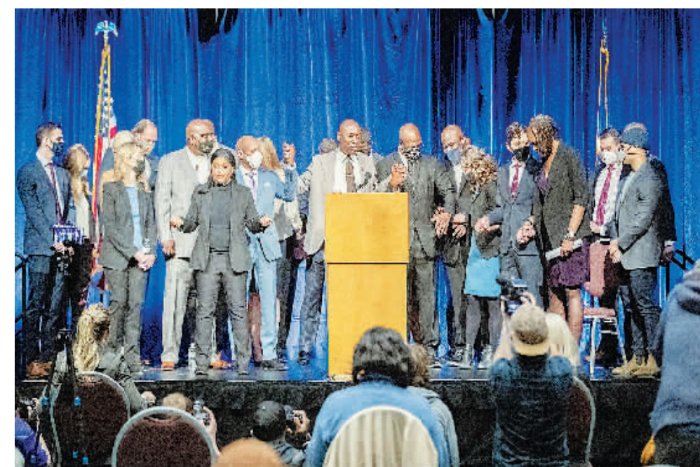
当地时间3月12日,明尼阿波利斯市议会宣布已与弗洛伊德家属达成民事诉讼协议。

当地时间3月12日,美国明尼阿波利斯市议会批准了一项价值2700万美元的民事和解协议,与乔治·弗洛伊德的家人就去年警方执法手段不当导致弗洛伊德死亡的案件达成和解。市议会以13票赞成、0票反对的结果全票通过了这项协议,并拨款50万美元在弗洛伊德的遇害地——芝加哥大街和38街的岔路口建造乔治·弗洛伊德纪念馆。