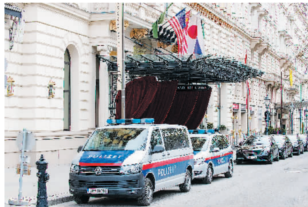
6日,奥地利维也纳,伊朗核问题全面协议相关方代表磋商美国重返伊核协议一事。

伊核协议参与国于4月6日在维也纳举行面对面会议,就全面恢复遵守该协议的具体步骤进行磋商。