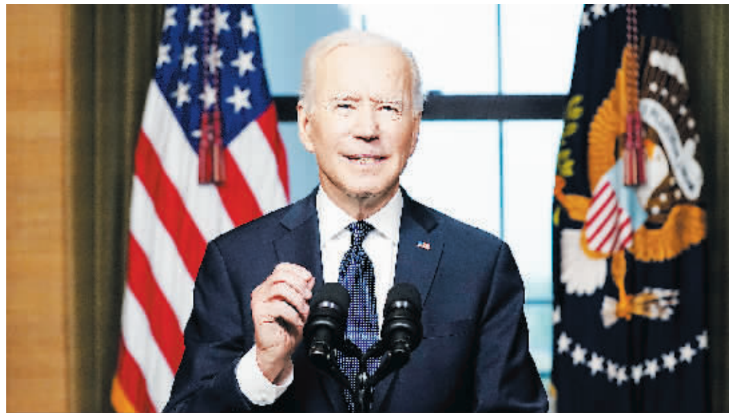
美国总统拜登14日宣布,驻阿富汗美军将于今年9月11日前撤出,以结束美国历史上最长的战争。

美国总统拜登14日宣布,驻阿富汗美军将于今年9月11日前撤出,以结束美国历史上最长的战争。同日,北约成员国外交部长和国防部长举行线上会议,决定从5月1日起的几个月内“从阿富汗撤出全部军队”。