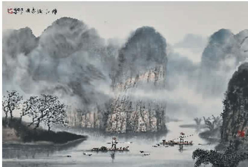
李德福《漓江渔乐图》