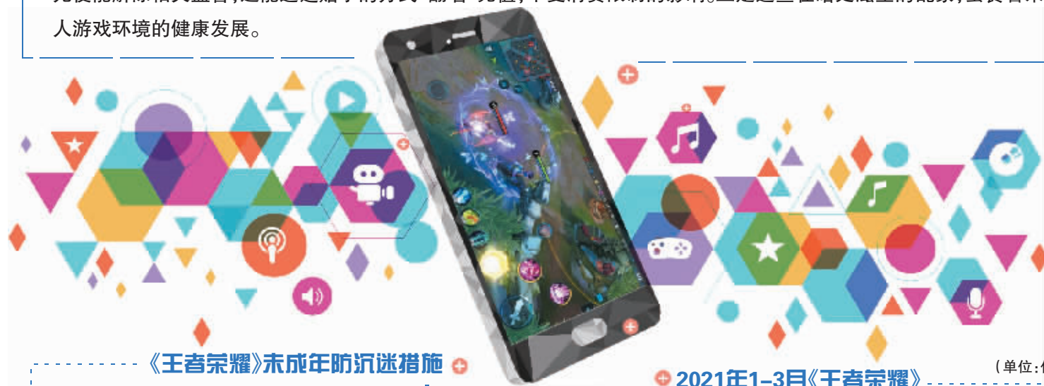
《王者荣耀》未成年防沉迷措施

6%,这是腾讯游戏此前在2020年四季度财报中首次披露的未成年游戏流水占比,同时还提及16岁以下未成年人的流水占比仅为3.2%。若按照正常充值方式计算,6%与3.2%无疑是腾讯游戏证明未成年人防沉迷监管成效的最好方式。但北京商报记者调查发现,这两个数字背后却存在着一个隐秘的角落,成为未成年人摆脱防沉迷监管的“避风港”,不仅只用120元便能解除相关监管,还能通过赠予的方式“翻墙”充值,不受消费限制的影响。正是这些在暗处滋生的乱象,蚕食着未成年人游戏环境的健康发展。