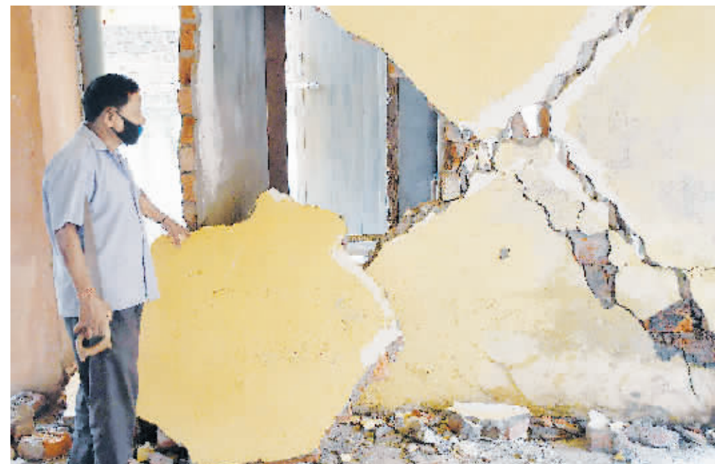
28日,印度东北部阿萨姆邦古瓦哈提,当地建筑物在地震中受损。

据印度国家地震中心28日测定,印度东北部阿萨姆邦当地时间28日7时51分发生6.4级地震。