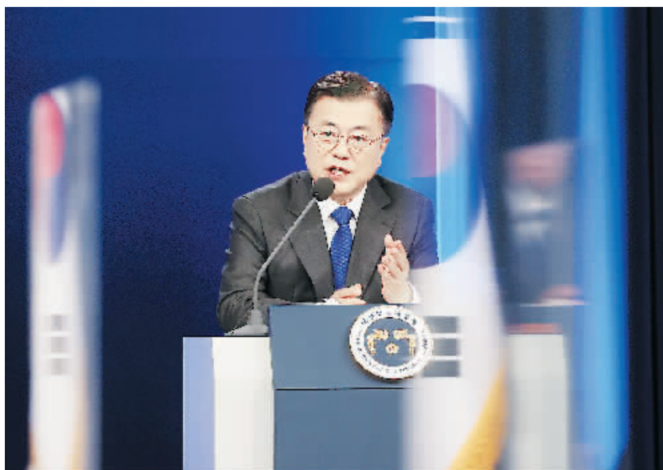
10日,韩国总统文在寅在首尔青瓦台发表讲话。

5月10日,在青瓦台春秋馆,韩国总统文在寅发表就职四周年特别讲话。文在寅在讲话中提到强调克服新冠危机,实现经济反弹以及重启朝鲜半岛和平进程等。