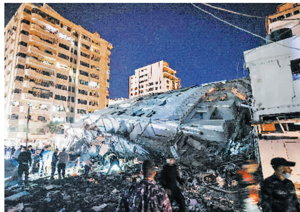
11日，人们聚集在加沙城遭以色列军队轰炸的废墟旁。

巴勒斯坦伊斯兰抵抗运动（哈马斯）12日说，以色列军队当天凌晨再次对加沙地带发动大规模猛烈空袭。据巴媒体报道，10日晚至12日早，以军轰炸共造成巴方35人死亡、233人受伤。