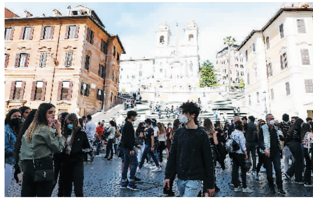
15日,游客在意大利首都罗马的西班牙广场上游览。

意大利16日正式对部分国家的游客开放边境。此前月初,意大利总理马里奥·德拉吉就曾宣布,意大利在本月中旬后开始向世界各地的游客开放。