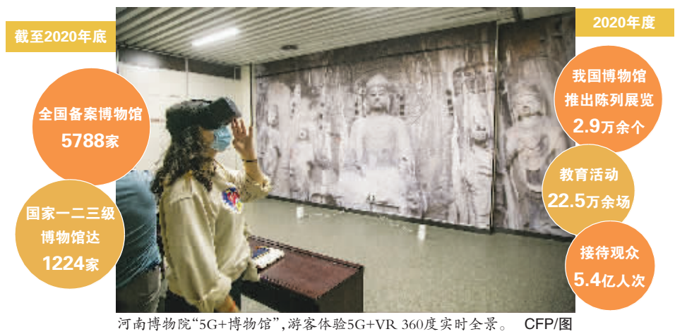
河南博物院“5G+博物馆”,游客体验5G+VR 360度实时全景。

北京商报讯(记者 胡晓钰)5月18日,伴随着2021年国际博物馆日的到来,围绕主题“博物馆的未来:恢复与重塑”,全国范围开展了数千场文博活动。