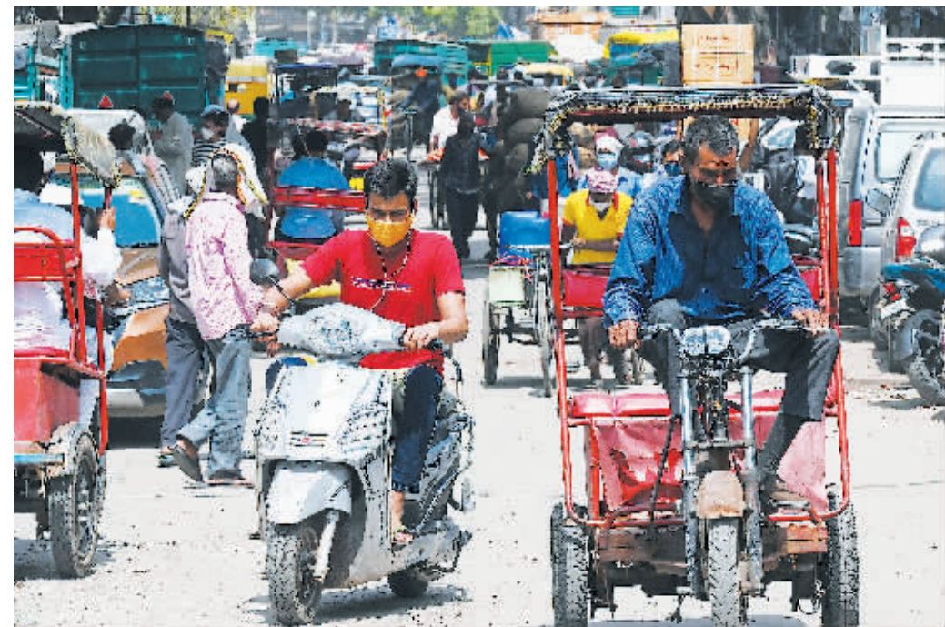
5日,人们在印度新德里街上出行。

北京商报讯(记者 陶凤 汤艺甜)根据印度卫生部公布的最新数据,截至当地时间6月6日8时(北京时间10时30分),过去24小时,印度新增新冠肺炎确诊病例114460例,累计确诊28809339例;新增死亡病例2677例,累计死亡346759例;累计治愈26984781例;现存确诊病例1477799例。