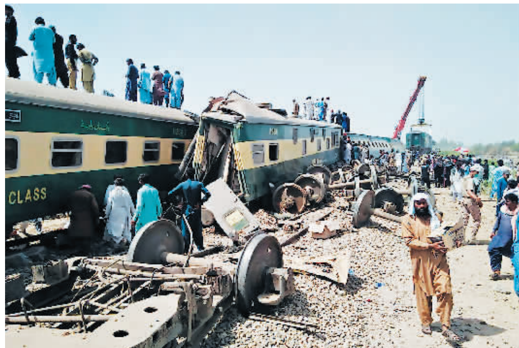
7日，人们在巴基斯坦信德省的火车相撞事故现场参与救援。

巴基斯坦南部信德省7日发生两列客运列车相撞事故，造成至少36人死亡、超过70人受伤。