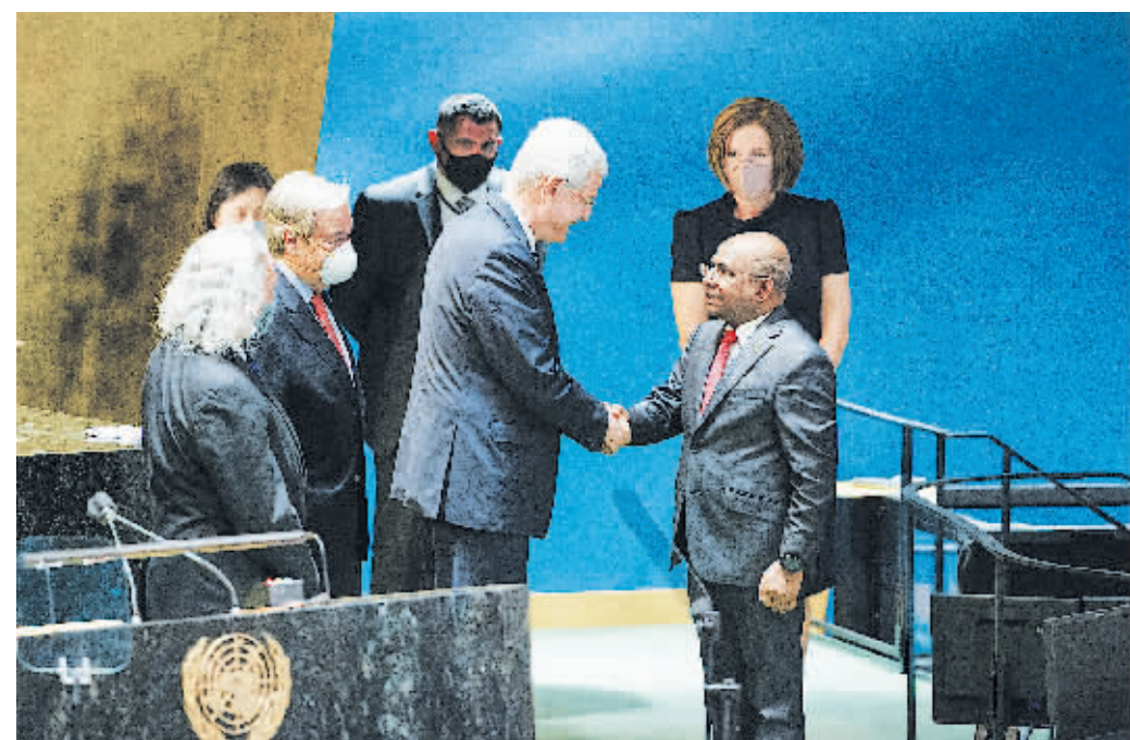
7日，在位于纽约的联合国总部，第75届联合国大会主席博兹克尔(前左)与当选第76届联合国大会主席的马尔代夫外长阿卜杜拉·沙希德握手。