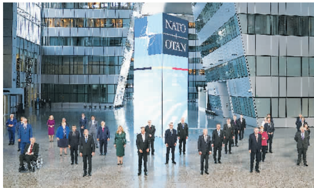
当地时间2021年6月14日,比利时首都布鲁塞尔,北约领导人峰会举行。

北约成员国领导人14日在位于比利时布鲁塞尔的北约总部举行会议。这是美国总统拜登今年1月上任后首次参加北约峰会。