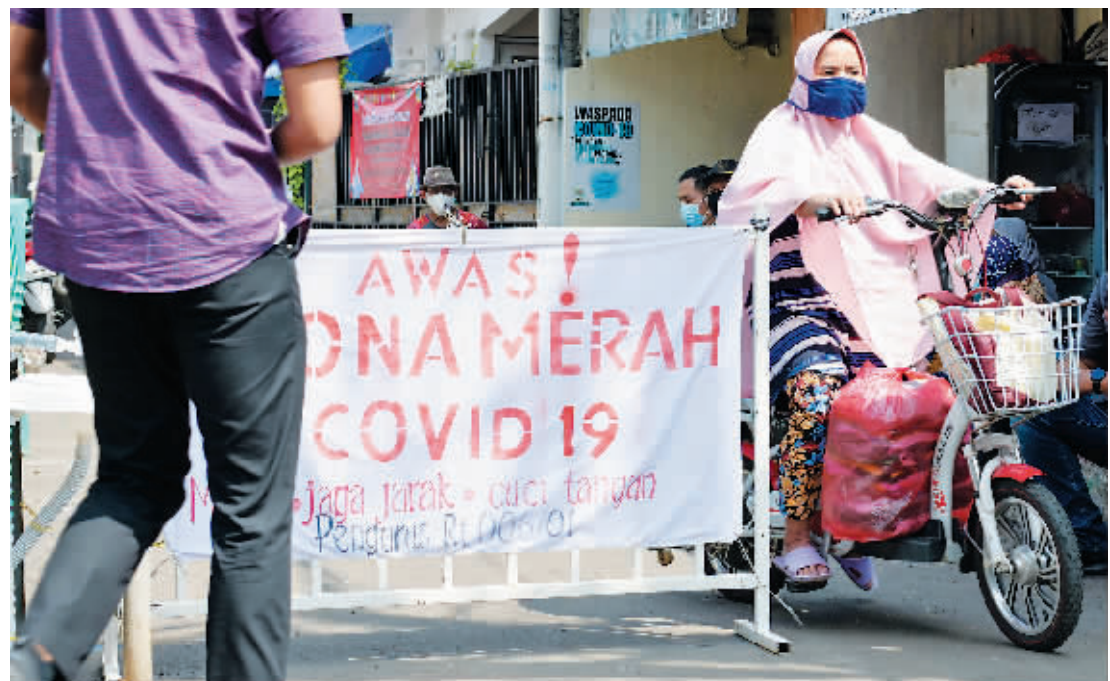
22日,一名女子骑车离开印度尼西亚雅加达一处因新冠疫情封锁的居民区。

世界卫生组织专家21日在日内瓦总部表示,新冠病毒变异毒株德尔塔目前已扩散至92个国家。虽然其传播性更强且人体在接种新冠疫苗后针对德尔塔毒株产生的中和抗体滴度有所降低,但疫苗对预防重症和减少死亡仍然有效。